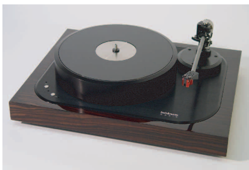
※仕上げ:エボニーマッカサー(グロス)

OASIS は、カラーレーションの少ない完璧なレコード再生のために、ブリックマンが独自に開発した超高精度ダイレクトドライブモーターを採用しました。従来、ダイレクトドライブモーターにはコギングがつきものでしたが、プラッターの回転数に応じて必要最小限のエネルギーのみを与えるブリックマン独自のテクノロジーと超低摩擦ベアリング、重量のあるプラッターにより、有害なコギングを大幅に低減しています。