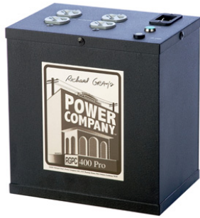
RGPC 400 Pro ¥ 166,000 (税別)