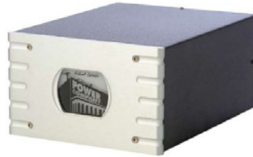
RGPC 600 S ¥ 272,000 (税別)